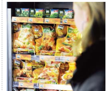
Heiß begehrt: Fertiggerichte aus dem Kühlregal.

Berlin. Satte 39,3 Kilogramm Tiefkühlkost (ohne Speiseeis!) verzehrt jeder Deutsche im Jahr. Am häufigsten kramen wir Backwaren aus der Truhe (19 Prozent aller Waren). Auf Platz zwei folgt Gemüse vor Fleischwaren, so das Deutsche Tiefkühlinstitut.