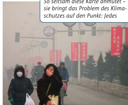
Dicke Luft: China verheizt enorm viel Kohle – das verursacht nicht nur Smog, sondern auch Treibhausgas.

Die verzerrte Welt der Treibhausgase So seltsam diese Karte anmutet – sie bringt das Problem des Klimaschutzes auf den Punkt: Jedes Land ist so groß, wie es seinem aktuellen Ausstoß des Treibhausgases CO 2 entspricht.