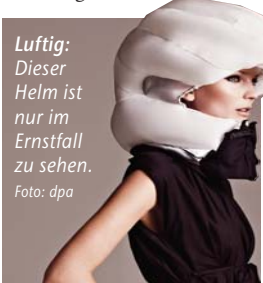
Luftig: Dieser Helm ist nur im Ernstfall zu sehen.

D ie Frau auf dem Rad trägt keinen Helm. Da geschieht es: Zusammenstoß mit einem Auto bei Tempo 20. Doch bevor sie vor der Windschutzscheibe aufschlägt, wird